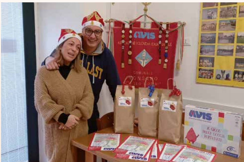
Incontro dei donatori Avis e consegna dei pacchi di Natale. Mostra dei disegni degli alunni della scuola di Monsano.

incontro dei donatori Avis e consegna dei pacchi di Natale. Mostra dei disegni degli alunni della scuola di Monsano.