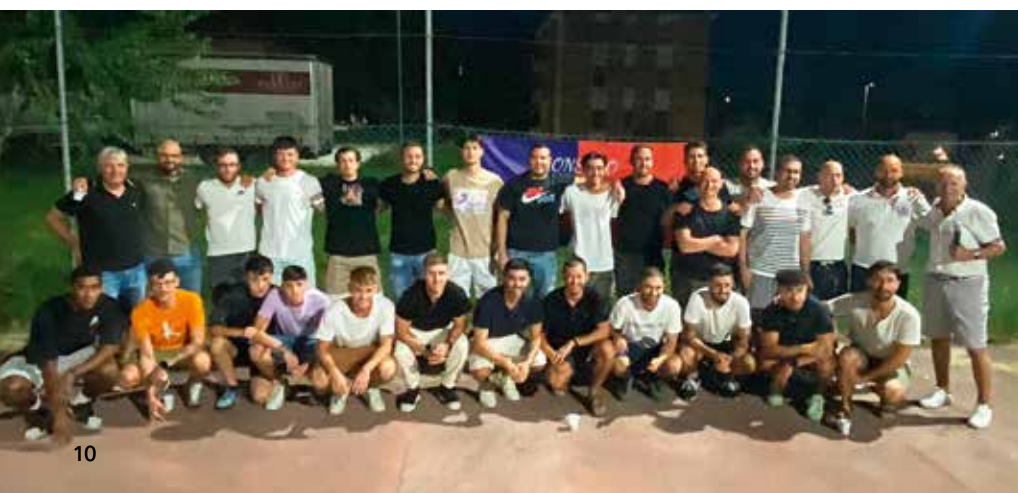
Foto della squadra al completo durante la presentazione